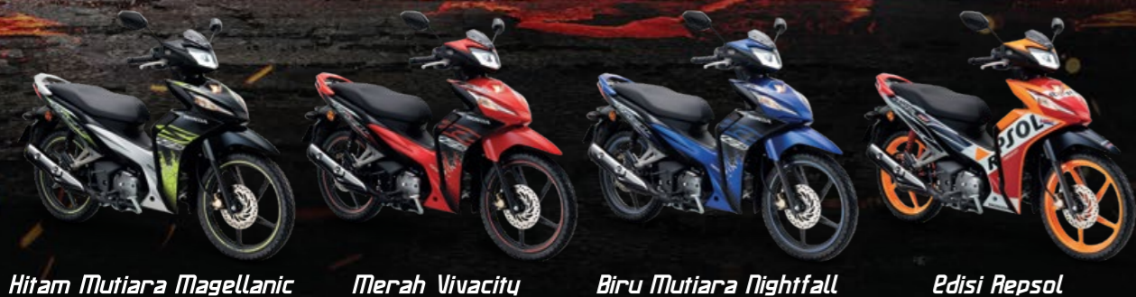
Dash 125 terdapat dalam Jenis - S (Brek Cakera Tunggal) dan Jenis - R (Brek Dwi Cakera). Edisi Repsol hanya terdapat dalam jenis Brek Dwi Cakera.

Gambaran yang dipaparkan adalah untuk tujuan ilustrasi sahaja. Spesifikasi adalah tertakluk pada perubahan, tanpa perlu sebarang notis terdahulu diberikan.